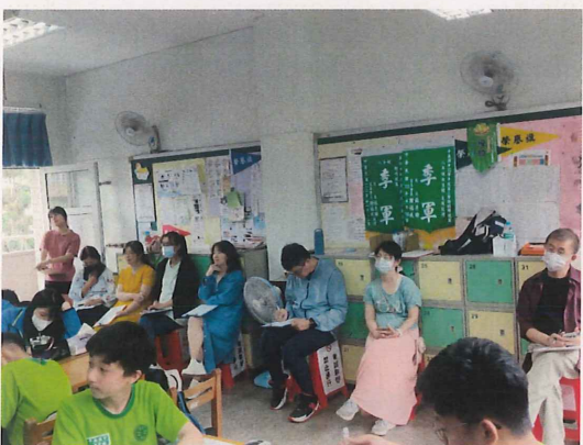
參加備觀議課教師觀課情形