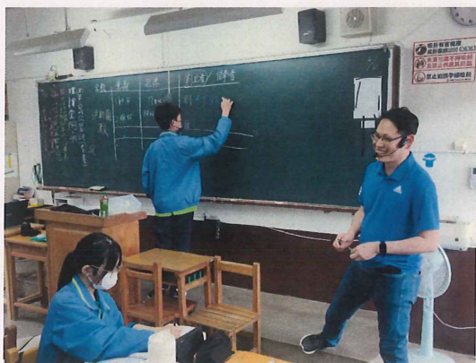
學生上台回答問題