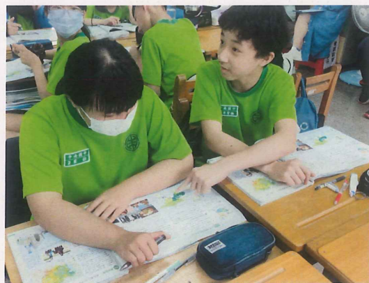
學生彼此討論，用心學習