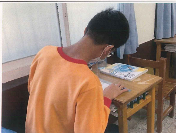
學生各別操作練習情形