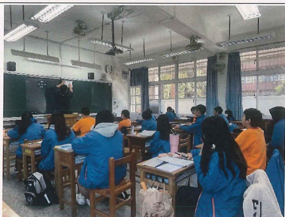
教師說明如何用直尺操作力矩的活動